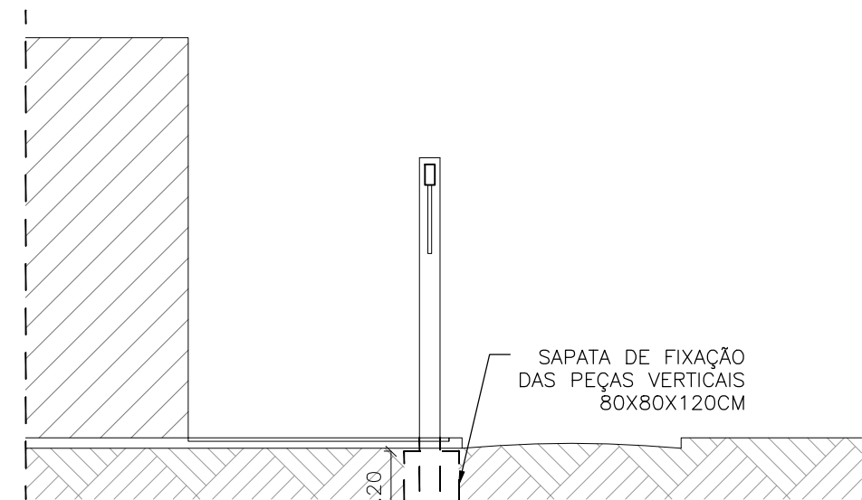
3 VISTA B ESCALA 1:100