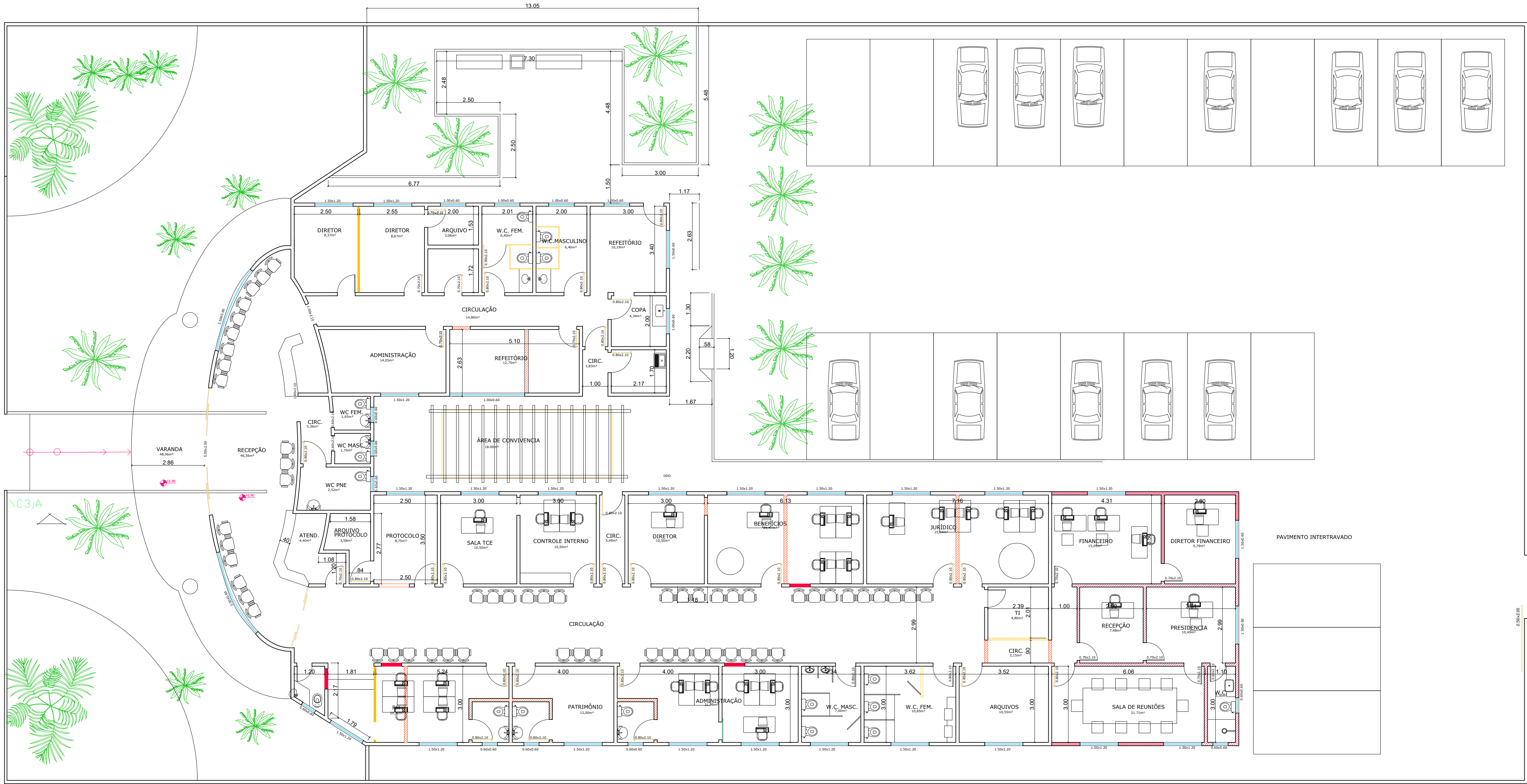
1 PLANTA BAIXA - IBASCAF/PASMED ESCALA: 1/100